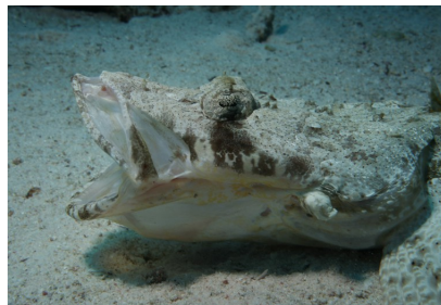
Krokodilfisch beim Fressen